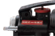
他吸式：集塵機接続