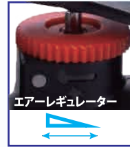
エアレギュレーター