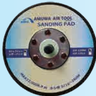
型式 ASP-125MH 低重心サンダー用 125mmφマジックパッド穴無 ネジ径 5/16"-24UNF

付属品 ATS-3506 本体 (1) ASP-125MH マジックパッド (1) サービスオイル (1) 20PMタイププラグ (1) パッド交換用スパン (1) 取扱説明書 (1)