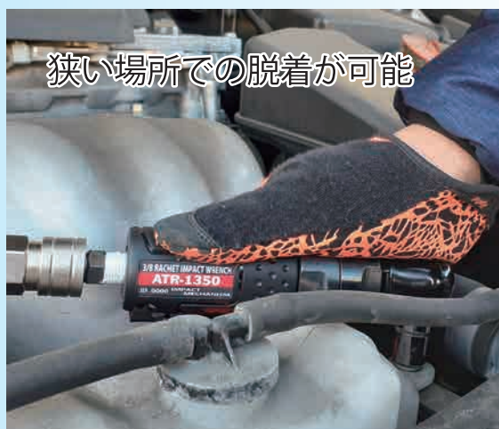
狭い場所での脱着が可能