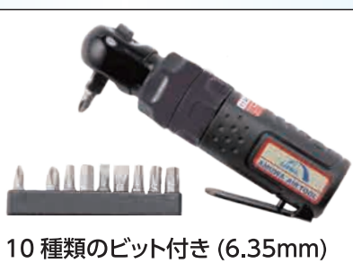
10種類のビット付き (6.35mm)