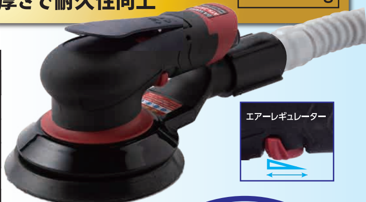
グリップするツインモールド