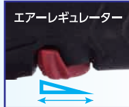
グリップするツインモールド

型式 ASP-125MH 125mmφマジックパッド穴無 ネジ径 5/16" - 24UNF