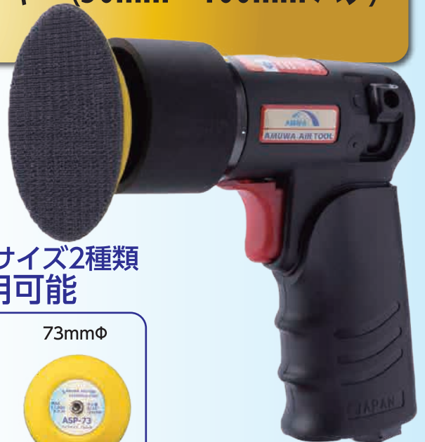
グリップカバー付き